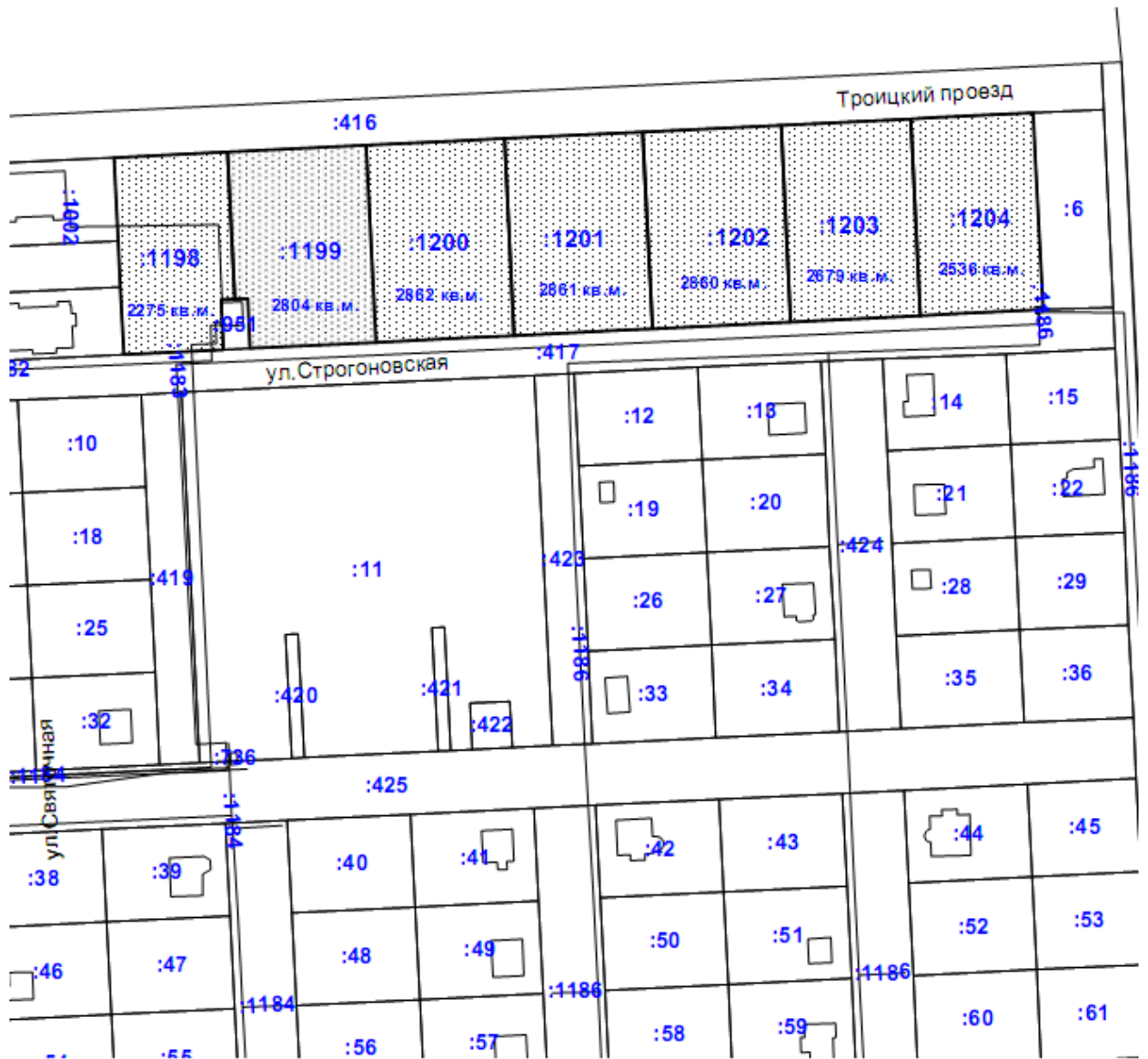
Схема площадки Зеленый-1 (восточней от ул. Рождественской)